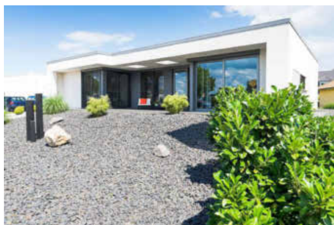
Das Wohnen auf einer Ebene ohne Treppenstufen überzeugt viele vom Bau eines Bungalows. Bei Flachdächern kommt es auf eine langlebige und effektive Wärmedämmung sowie Abdichtung an.

eine verlässliche Abdichtung sowie eine wirksame Wärmedämmung. Speziell dafür ausgelegte Dämmsysteme wie BauderECO F erfüllen nicht nur diese Anforderungen, sondern unterstützen gleichzeitig ein nachhaltiges Bauen. Das Material besteht zu zwei Dritteln aus Biomasse, ist umweltfreundlich und fördert ein gesundes Wohnklima. Unter www.ratgeberdach.de gibt es weitere Tipps.