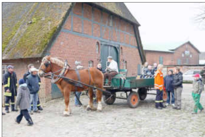
Ein Bild vom Dorfputz 2009, auch dabei ein Pferdegespann