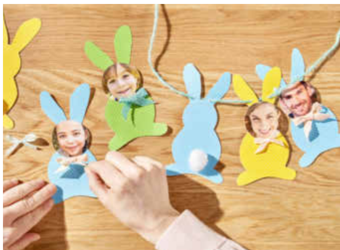
Eine selbst gebastelte Osterkette mit Familienfotos bringt Farbe in jedes Haus und kommt als kreatives Geschenk mit Sicherheit gut an.

(djd). Am Osterwochenende kommt die ganze Familie zusammen, um den Frühling zu begrüßen und lieb gewonnene Rituale zu pflegen. Dazu gehören kleine Mitbringsel und Überraschungen - am liebsten kreativ und selbst gemacht. Eine Osterkette mit Familienfotos zum Beispiel bringt gemeinsame Erinnerungen besonders gut zur Geltung. Dazu braucht es lediglich Bastelkarton in frühlingshaften Farben, Schere, Klebstoff, eine Kordel sowie verschiedene Lieblingsbilder. Besonders schnell ist die Deko mit Sofortfotos gemacht, die sich beispielsweise an einer Cewe Fotostation ausdrucken lassen. Die Feiertage bieten außerdem genug Zeit, um in großer Familienrunde miteinander zu spielen. Ein personalisiertes Memo-Spiel lässt sich zum Beispiel unter www.cewe.de kreativ mit eigenen Fotos gestalten.