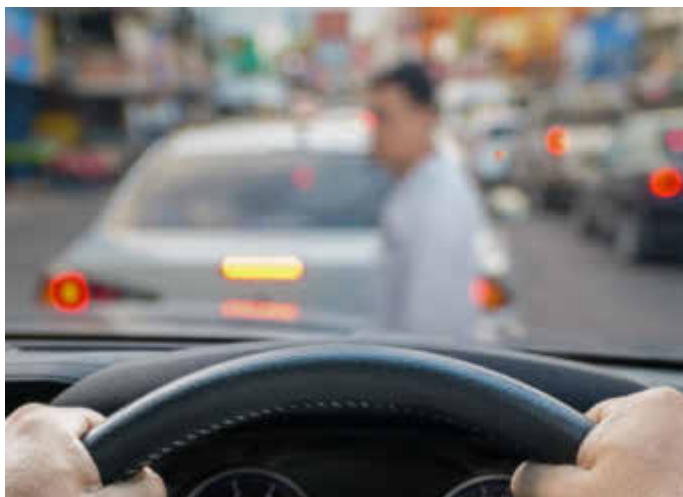
Unachtsamkeit am Steuer kann schwerwiegende Folgen haben, gerade im quirligen Stadtverkehr. Technik kann dabei den Menschen unterstützen und die schwächsten Verkehrsteilnehmer besser schützen.

(djd). Im dichten Getümmel des Stadtverkehrs treffen Autos, Radfahrer, Fußgänger und E-Scooter aufeinander. Von der Person am Steuer wird jederzeit volle Konzentration verlangt, denn schon eine kurze Ablenkung kann zu einer Kollision führen. Fahrerassistenzsysteme können dabei den Menschen entlasten, Gefahren frühzeitig erkennen und im Ernstfall schnell reagieren - beispielsweise mit einer Notbremsung. Nach Ergebnissen der Bosch Corporate