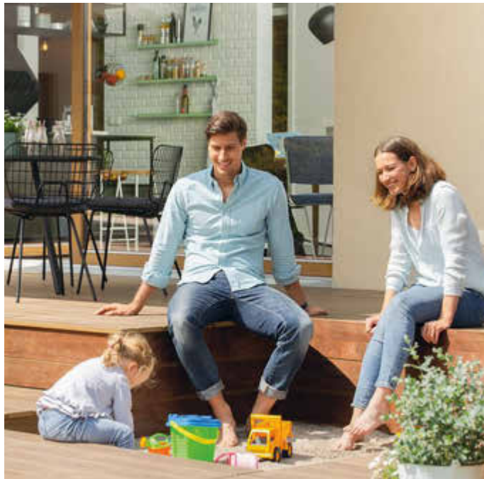
Ein energiesparendes und nachhaltiges Eigenheim wünschen sich gerade heute viele Familien.

mit einer Photovoltaikanlage mit Speichersystem sowie mit Frischluft-Wärmetechnik und einer smarten Haussteuerung ausgestattet. Zusätzlich können alle Ein- und Zweifamilienhäuser mit dem "Qualitätssiegel Nachhaltiges Gebäude" (QNG) zertifiziert werden. Es ist Voraussetzung für die staatliche Förderung. Infos zu den Häusern inklusive 18-monatiger Festpreisgarantie gibt es unter www.weberhaus.de .