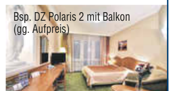
Bsp. DZ Polaris 2 mit Balkon (gg. Aufpreis)