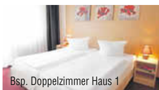
Bsp. Doppelzimmer Haus 1