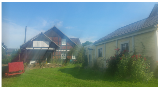
Wohnhaus mit Nebengebäude Ost