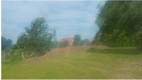
Walnussbaum mit Grünstreifen