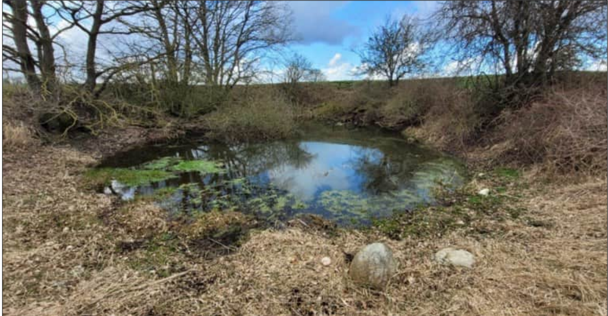
Abbildung 5: Gewässer 3 in nordwestliche Richtung

gegenüberliegende Gewässerteil im Südosten ist hingegen offen und gut besonnt. Der Übergang vom Uferbereich ins Gewässer ist durchgehend flach. Unterwasservegetation ist kaum vorhanden. Der Wasserpegel sank, wie auch bei den übrigen Untersuchungsgewässern im Untersuchungsgebiet von März bis Ende Juni schnell und rapide ab, so dass sich im Juli das Wasser fast bis auf die Gewässermitte zurückgezogen hatte.