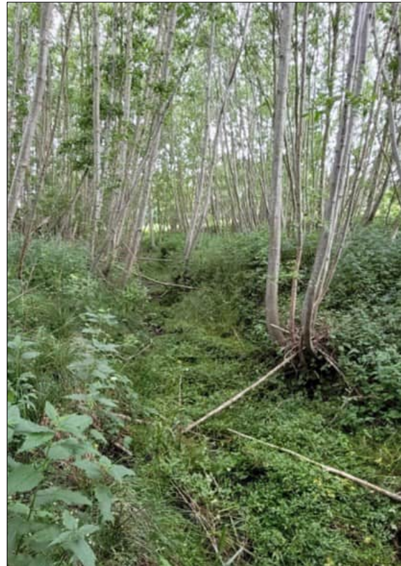
Abbildung 10: Trockengefallenes Fließgewässer