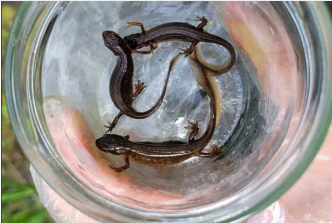
Abbildung 17: Drei weibliche Teichmolche aus Reusenfang