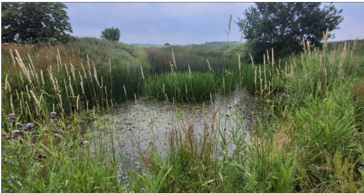
Abbildung 2: Gewässer 1 in westliche Blickrichtung