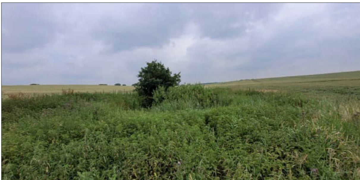
Abbildung 4: Gewässer 2 in nordöstliche Blickrichtung