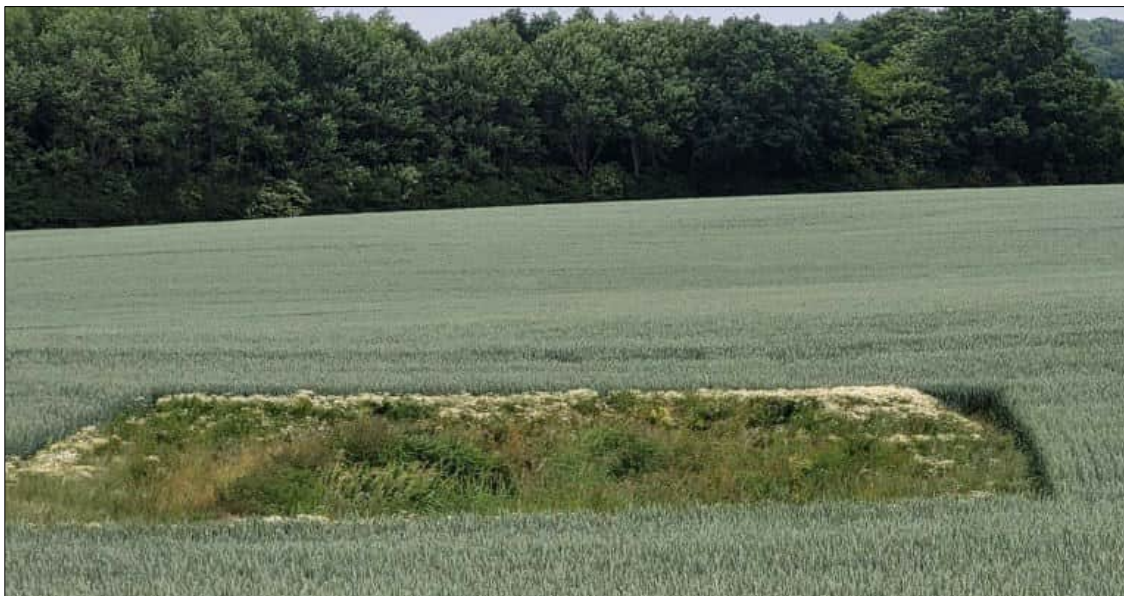
Abbildung 8: Gewässer 4 in östliche Blickrichtung