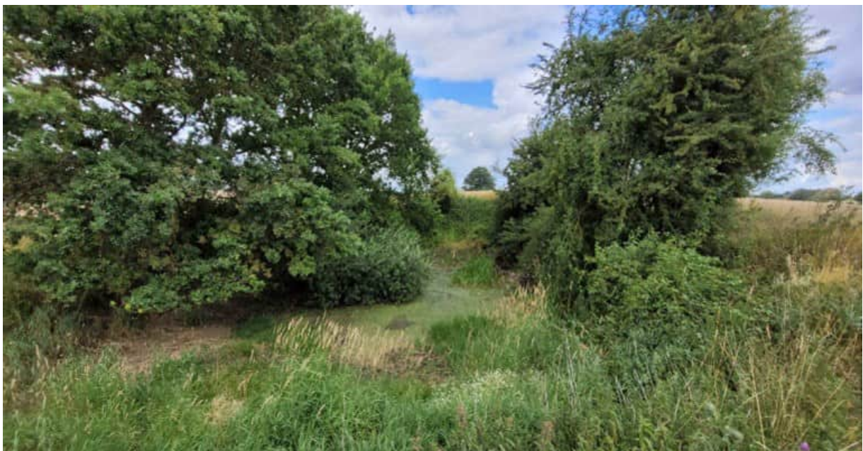
Abbildung 6: Gewässer 3 in nordwestliche Richtung