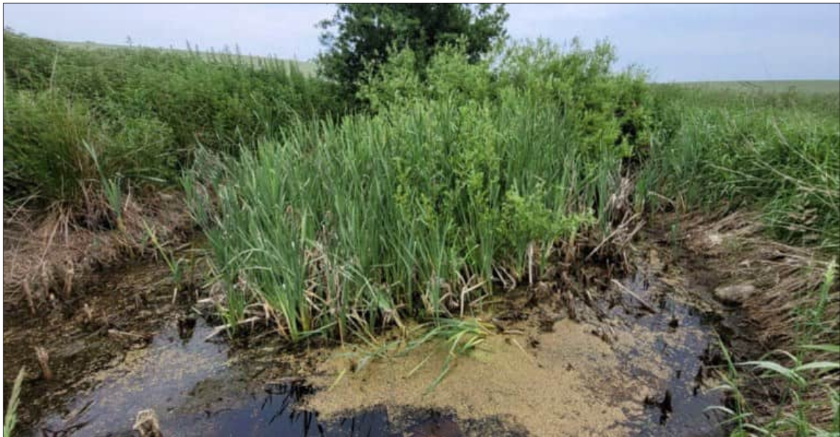
Abbildung 3: Gewässer 2 in nordöstliche Blickrichtung

Bereits im März war Gewässer 2 stark eutrophiert, sodass die Gewässeroberfläche mit einem Algent Teppich überzogen war. Der Wasserstand sank von etwa einem Meter im März auf wenige Zentimeter ab bzw. zog sich bis Ende Juli fast vollständig in die Gewässermitte zurück.