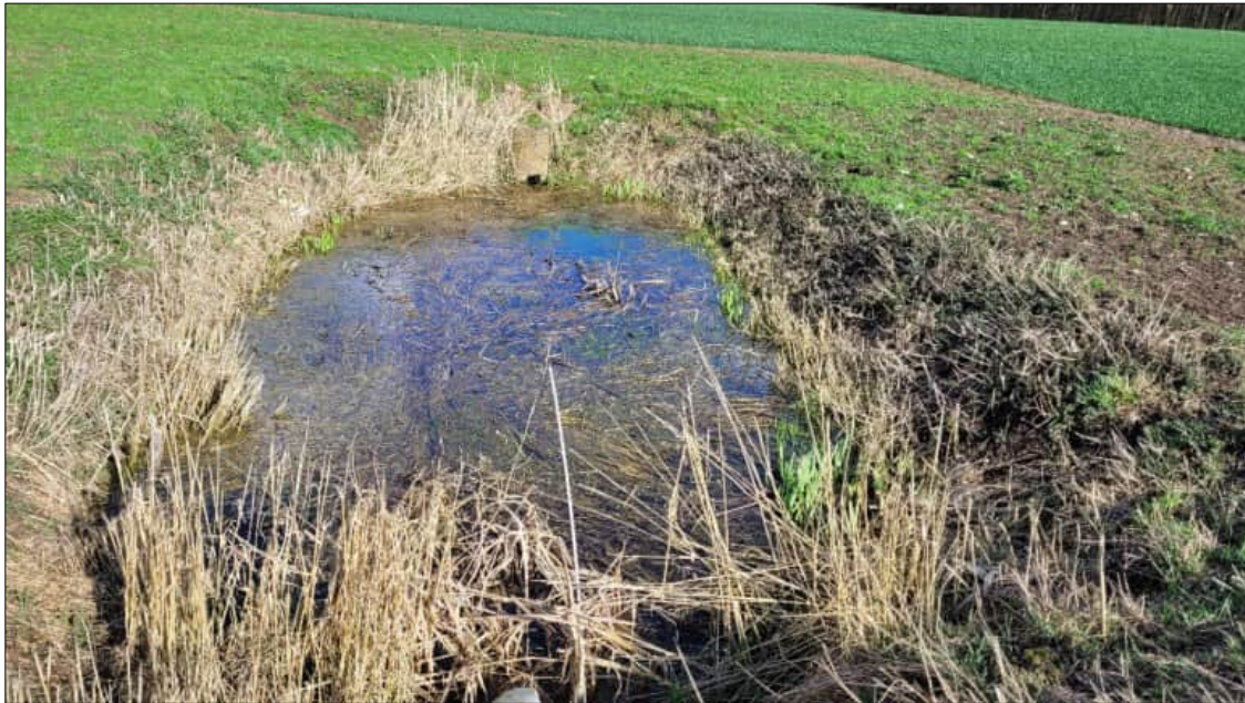
Abbildung 7: Gewässer 4 in östliche Blickrichtung

Etwa 6 x 4 m großes, beinahe rechteckiges Kleingewässer innerhalb einer Landwirtschaftsfläche. In den östlichen Teil des Gewässers ragt eine Drainage rein, durch die vermutlich die angrenzende Fläche entwässert wird. Das Gewässerufer weist ein durchgehend steiles und mit Schilf bewachsenes Ufer auf. Im Uferbereich ist partiell Unterwasservegetation vorhanden. Die Gewässertiefe sank zügig von März bis Mitte Mai von ca. 40 cm auf wenige Zentimeter ab und war Anfang Juni komplett trockengefallen. Durch den Nährstoffeintrag der angrenzenden Flächen war auf der Oberfläche des Gewässers bereits im März ein starker Algenteppich ausgebildet.