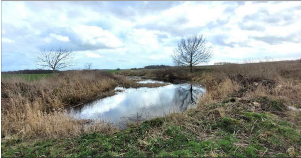
Abbildung 1: Gewässer 1 in westliche Blickrichtung