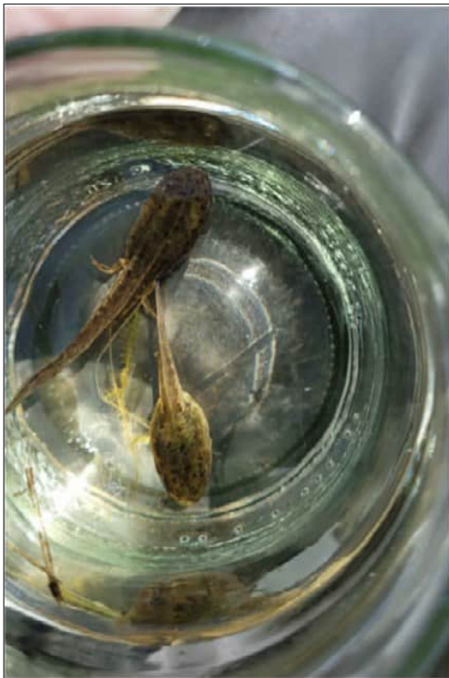
Abbildung 16: Teichfroschlarven aus Gewässer 1