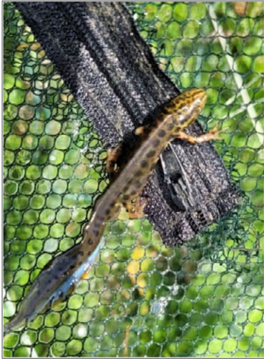
Abbildung 14: Männlicher Teichmolch