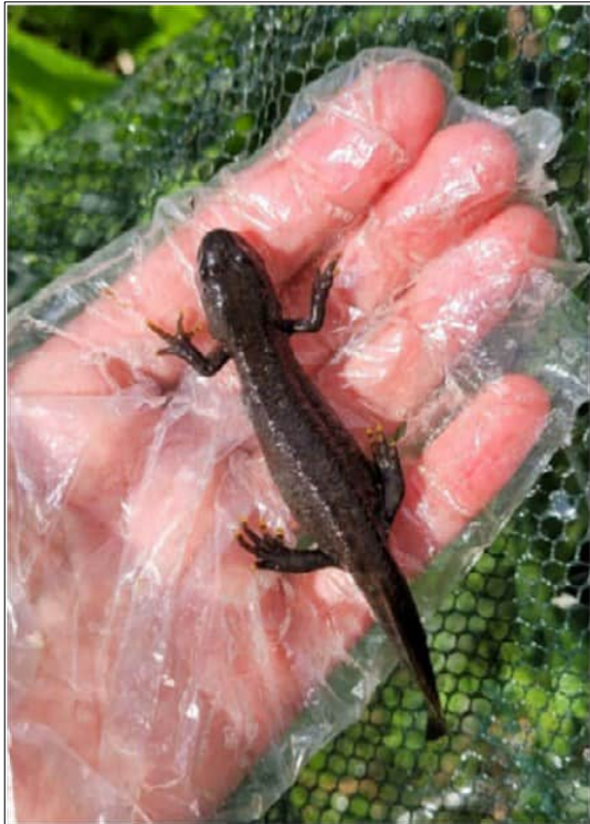
Abbildung 11: Kammolchweibchen