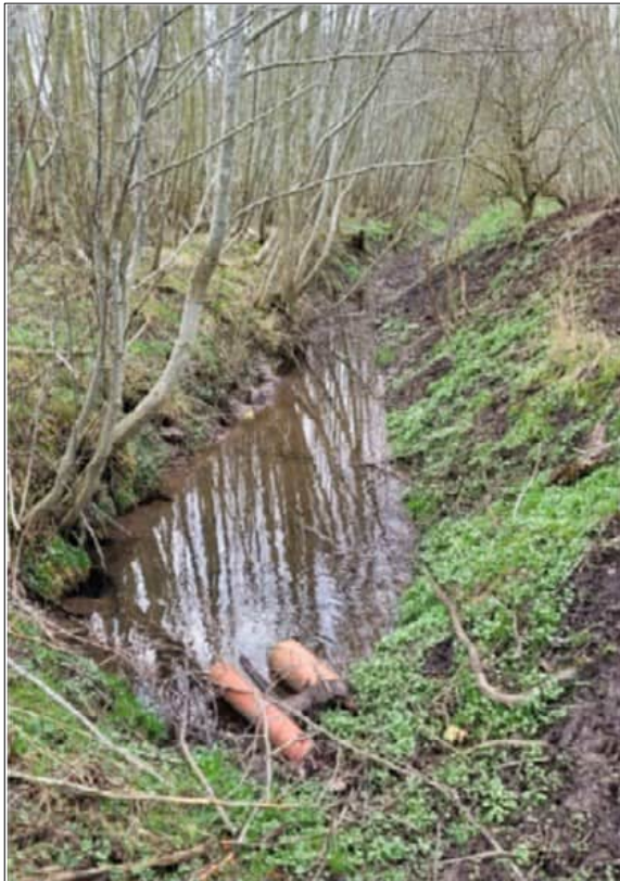
Abbildung 9: Drainagen am nordöstlichen Ufer

Das bis zu 1,20 m breite Fließgewässer ist beidseitig mit einem bis zu 6 m breiten Gürtel aus jungen Grauerlen zugewachsen und im belaubten Zustand entsprechend stark beschattet. Das bis zu 1 m tief abfallende Ufer weist außer dem Gehölzaufwuchs weder uferbegleitende noch Unterwasservegetation auf. Am nordöstlichen Ende ragen Drainagen in das Gewässer rein (Abbildung 9). Bei der Erfassung im März wurde ein sehr geringer Wasserstand von wenigen Zentimetern verzeichnet. Mitte Juni war das Gewässer komplett trockengefallen (Abbildung 10), sodass die Amphibienkartierung dort eingestellt wurde.