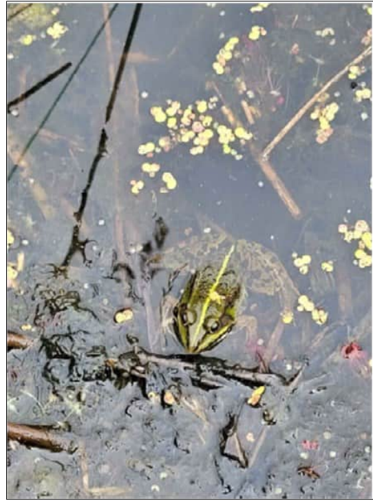
Abbildung 15: Adulter Teichfrosch im Wasser