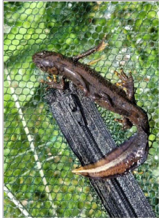
Abbildung 12: Kammolchmännchen