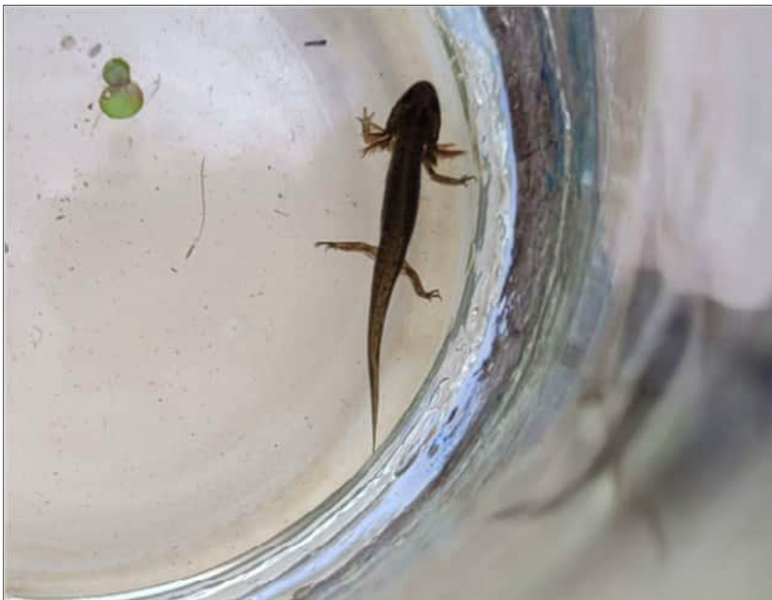
Abbildung 18: Teichmolchlarve