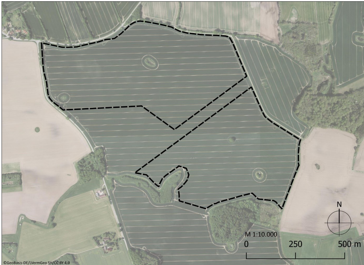
Abbildung 2: Lage des sonstigen Sondergebiets (PV) des B-Plans Nr. 13 und FNP 11. Ä. „Solarpark Pronstorf“