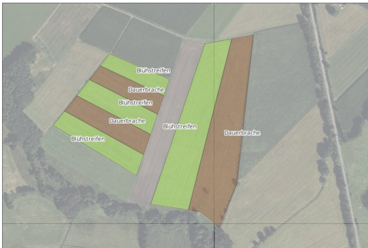
Abbildung 6: Beispielhafte Darstellung zur Anlage von Blühstreifen abwechselnd neben Ackerbrache oder großflächig nebeneinander